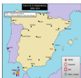
49. CATALUÑA (Bruch, Barcelona, Gerona)