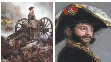
48. AGUSTINA Y PALAFOX (sólo diapositiva).

Zaragoza sufriría un segundo asedio, más férreo si cabe, en la segunda fase de la guerra, entre el 21 de diciembre de 1808 y el 21 de febrero del año siguiente.